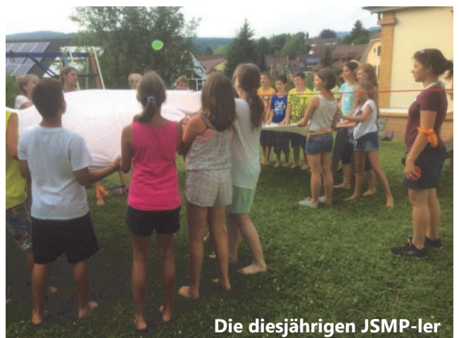
Die diesjährigen JSMP-ler

Ihre Zielgruppe, 21 SchülerInnen einer 5. Klasse der August-Macke-Schule, hatten eine riesige Freude und waren schwer beeindruckt, dass sich andere Schüler so viel Mühe für sie gaben. Die gut vorbereiteten Spiele, die Klassendisco und die Versorgung mit leckeren Hamburgern kamen also bestens an. Mit diesem Projekt erwerben die acht Teilnehmer das begehrte Zertifikat des Kultusministeriums, das sie im nächsten Schuljahr überreicht bekommen.