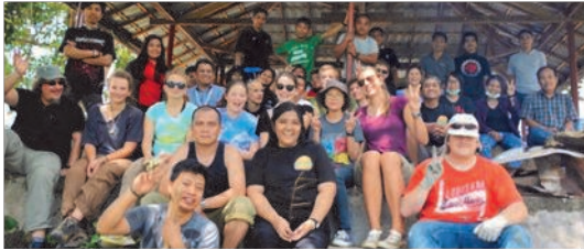
Jugendliche beim Workcamp 2015 in Indonesien